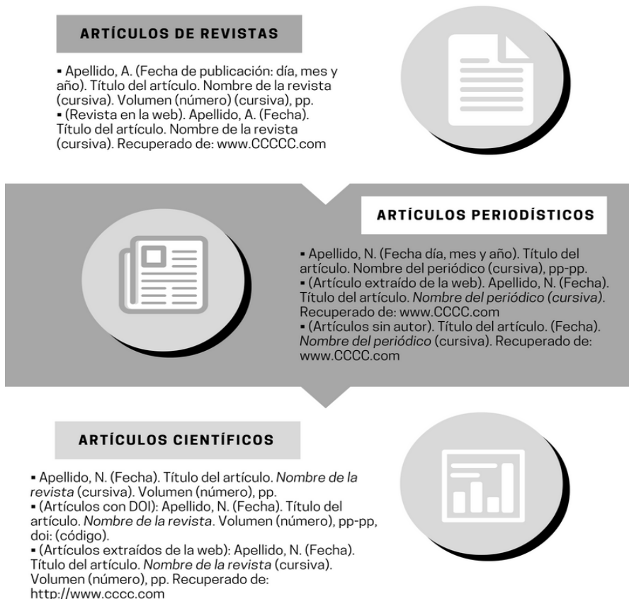
Figura n.º 4. Resumen normas APA. Elaboración propia. Fuente: www.normasapa.com